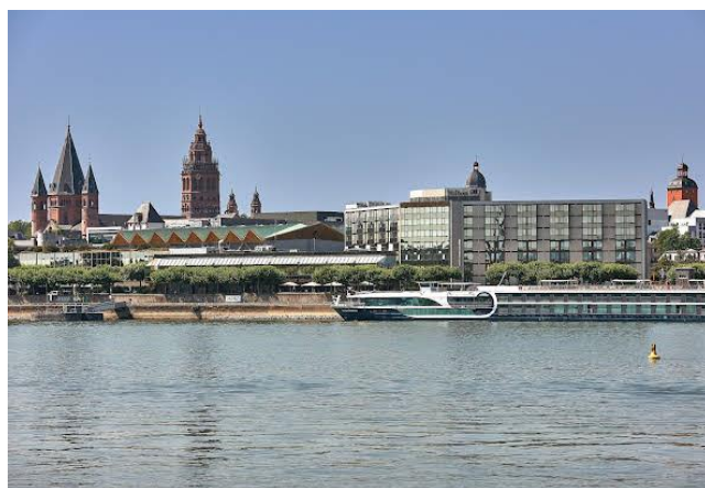
Hotel Hilton Mainz, direkt vor der Altstadt, am Rheinufer

Teilnehmer: Mindestens 16, max. 28 Reisegäste